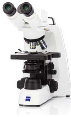
Primostar 3 (双眼)