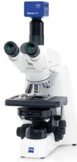
Primostar 3 + Educam 105