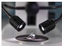
サンプル作成に最適なダブルアーム照明