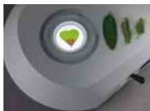
明・暗視野の切替え可能な透過照明