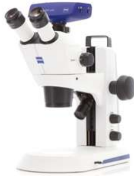
Stemi 305 (三眼) EDU ※三眼セットにはデジタルカメラは含まれません。