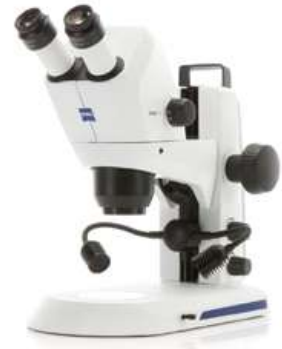
Stemi 305 cam