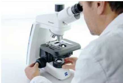
余分なアクセサリボックスやケーブルは一切不要