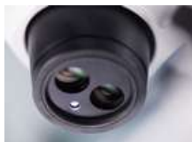
本体内蔵同軸照明