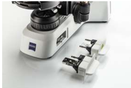
ハロゲン電球または省エネの3W LED照明のいずれかを使用して、安定した色温度や光量を提供します