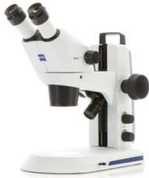
Stemi 305 (双眼) EDU

Wi-Fiカメラ内蔵実体顕微鏡 Stemi 305 camはカメラがリニューアルされ新発売しました。