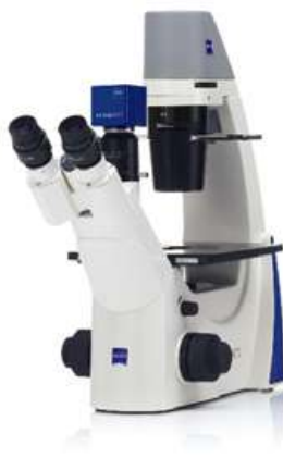
Primovert + Educam 105