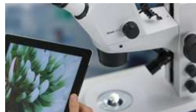
各種タブレット端末・スマートフォンから制御が可能