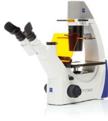
Primovert iLED 蛍光