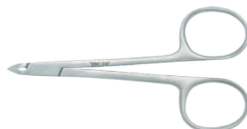
80-060 キューティクルニッパー 10cm 先端6mm