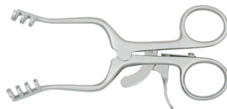
21-424 ウエイトライナー開創器 13cm 鈍