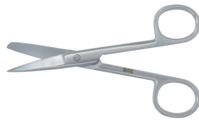
13-100 外科剪刀 11.5cm 直片鋭