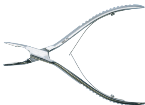
13-703 フリーデマン骨鉗子 14cm