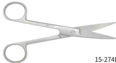
15-274L 左手用外科剪刀 14.5cm 曲 両鋭