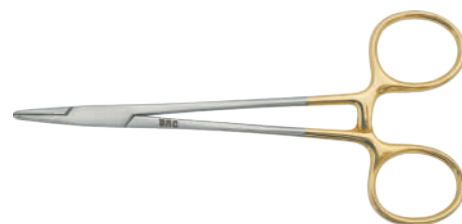
PRI22-5009 ハルセイ持針器 13cm/TC