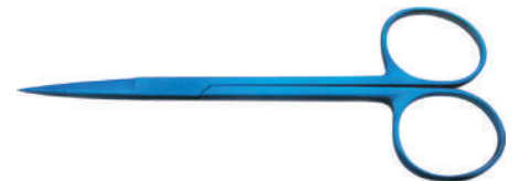
1403062 アイリス剪刀 110mm 直