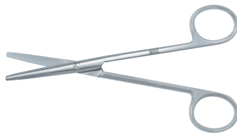
13-200 メツェンバウム型剪刀 14cm 直