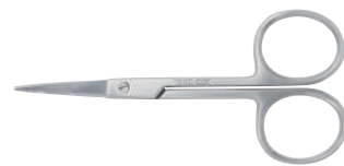
13-181 アイリス剪刀 9cm 直