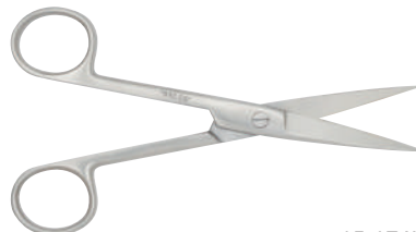
15-174L 左手用外科剪刀 14.5cm 直 両鋭