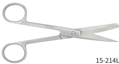
15-214L 左手用外科剪刀 14.5cm 曲 片鋭