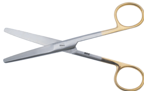
PRI28-1529A 外科手術剪刀 14.5cm 直両鈍/TC