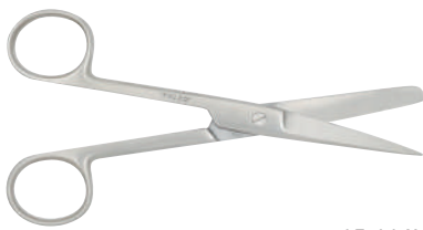
15-114L 左手用外科剪刀 14.5cm 直 片鋭