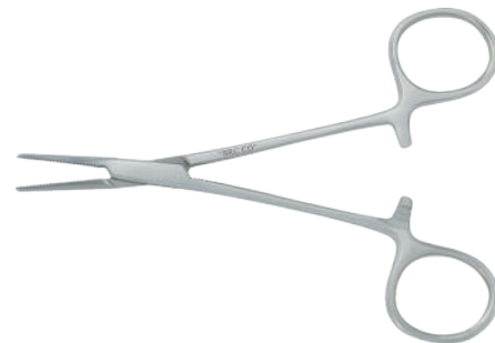
18-166 ハルスタット・モスキート止血鉗子 12.5cm 直