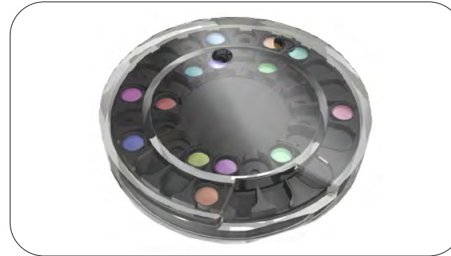
ダイナミックフィルターホイール