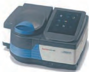
Thermo Scientific™ GENESYS™ 40 可視分光 光度計 / GENESYS™ 50 紫外可視分光光度計