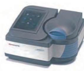
Thermo Scientific™ BioMate™ 160 / Thermo Scientific™ GENESYS™ 180 紫外可視分光光度計