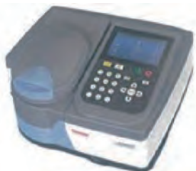
Thermo Scientific™ GENESYS™ 30 可視分光光度計