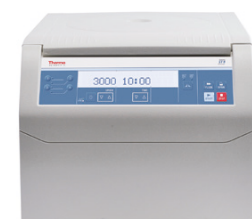
ST 8 (冷却なし)