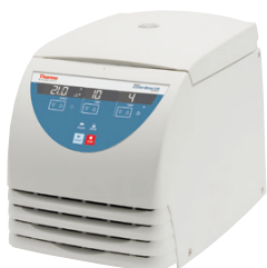
Micro 21R (冷却付き)