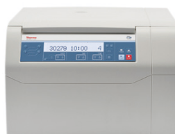
ST 8R (冷却付き)