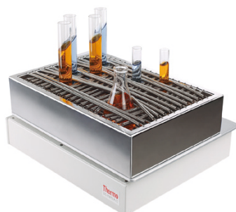
スプリングワイヤーラック