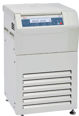
ST 8FR (冷却付き)