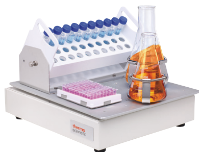
MaxQ 2000 CO2 Plus