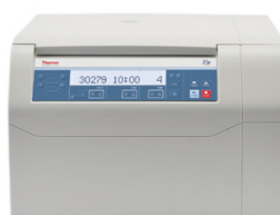
ST 8R (冷却付き)