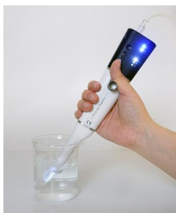
Plasma stimulated medium