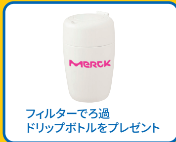
フィルターでろ過 ドリップボトルをプレゼント

*1 NMWL (公称分画分子量) 限外ろ過膜の分離性能は孔径で規定することが困難なため、標準物質の阻止率を測定することで規定しています。 これを公称分画分子量 (Nominal Molecular Weight Limit: NMWL) といいます。